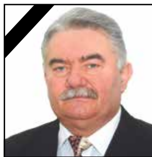
Čeť jeho pamiatke!

Vyjadrujeme hlbokú a úprimnú sústrasť rodine a blízkym.