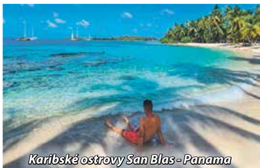
Karibské ostrovy San Blas - Panama

Úprimne neviem odpovedať, v najbližšej dobe si dám asi pauzu od dlhodobého cestovania, ale pôjdem aspoň na týždeň až