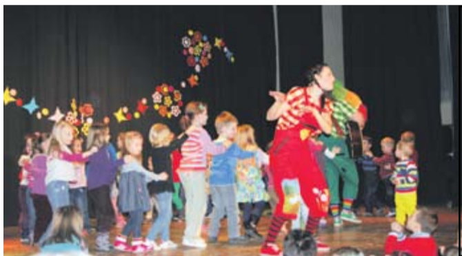
Spievanka a Zahrajko s deťmi na koncerte, ktorý pripravilo MS Anjelikovo a MsKS a uskutočnil sa 9. apríla.