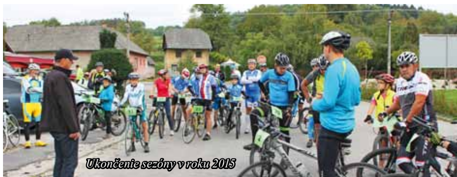
Ukončenie sezóny v roku 2015