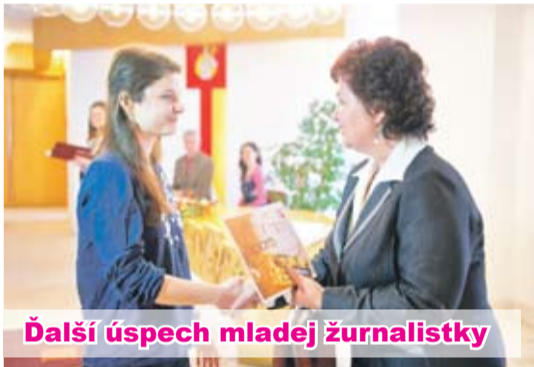
Ďalší úspech mladej žurnalistky