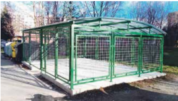
Kryté stojisko na Ul. J. C. Hronského

Pokračovali sme i v budovaní uzamykateľných stojísk na kontajnery. V minulom roku sa jedno stojisko umiestnilo na sídlisko Sever na križovatke ulíc J. Matušku a K nemocnici a druhé na ulici Palkovičova. Spolu tak máme v našom meste desať krytých stojísk.