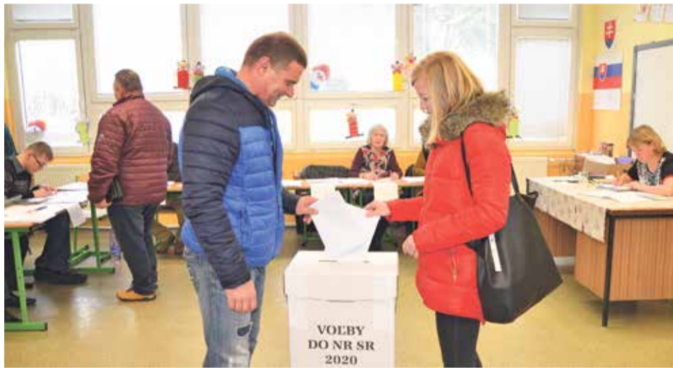
Bánovčania - manželka Hájkovi hlasovali v jednej z volebných miestností ZŠ Komenského

Najmladšia politická strana - Koalícia Progresívne Slovensko a SPOLU, ktorá vznikla len koncom