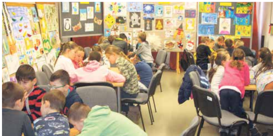
V rámci jarných prázdnin navštívili deti prímestského tábora CVČ aj knižničnú spoločenskú miestnosť s výstavou Svet malého škôlkára, kde absolvovali súťažný kvíz...

Marec – Mesiac knihy je aj výnimočnou príležitosťou pre tých najväčších milovníkov kníh, ktorým preplnené regály domácej knižnice nebránia