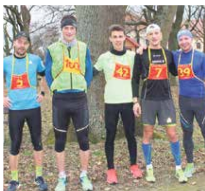
Prví piati v hlavnej kategórii