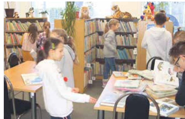
Deti zo ZŠ Gorazdova pri výmene kníh v detskom oddelení

„K tradíciám knižnice patria stretnutia po rokoch, tento raz v piatok 13. marca sa v knižnici stretnú bývalí zamestnanci, najmä zamest-