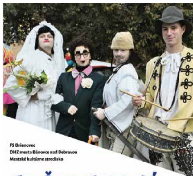
FS Drienovec DHZ mesta Bánovce nad Bebravou Mestské kultúrne stredisko