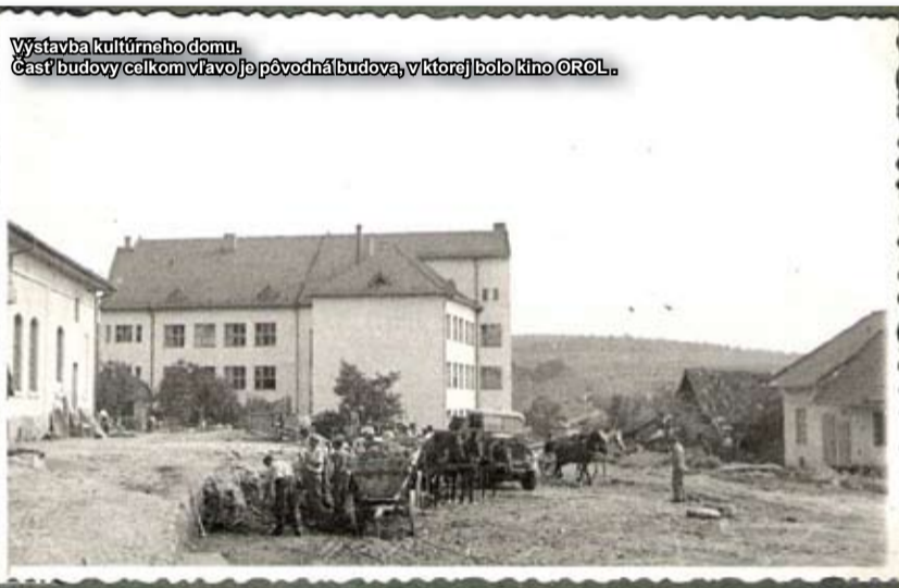
Výstavba kultúrneho domu. Časť budovy celkom vľavo je pôvodná budova, v ktorej bolo kino OROL.