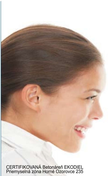
CERTIFIKOVANÁ Betonáreň EKODIEL Priemyselná zóna Horné Ozorovce 235

☎ 0908 24 97 97 ☎ 038/760 8031 ✉ beton@ekodiel.sk