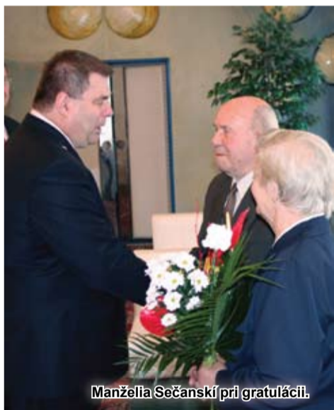
Manželia Sečanskí pri gratulácii.