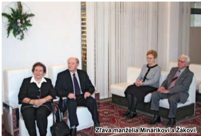
Zľava manželia Minárikoví a Žákoví.

Tento rok odznelo mnoho na tému Manželstvo – viac ako papier a počas príhovorov a prednášok sa často zdôrazňovalo i to, že manželstvo nie je len formálny právny vzťah, ktorý spája muža a ženu, ale svoj zmysel má práve vtedy, ak je jeho náplňou láska, vernosť, bezpečie a rodinné spolužitie.