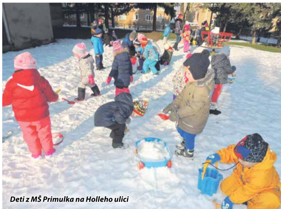
Deti z MŠ Primulka na Holleho ulici

Slávka Janegová, riaditeľka MŠ Radlinského: Od začiatku tohto roka sme mali v škôlke 30 až 35 % detí, 40 až 45 % pedagogických zamestnancov, podľa počtu detí v daný týždeň. Naša materská škola bola v karanténe na základe rozhodnutia RÚVZ v Trenčíne od 5. do 14. februára. Momentálne máme