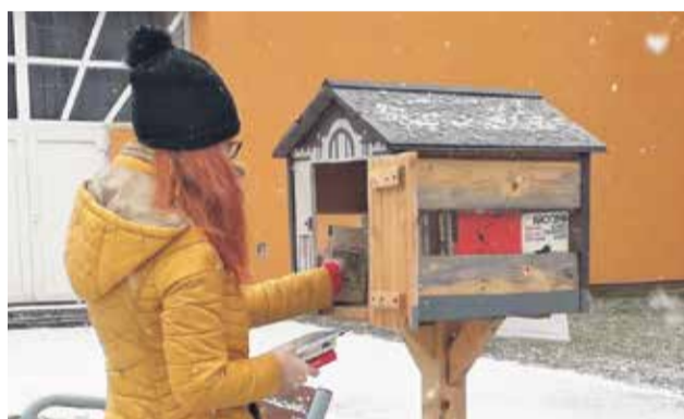
Opäť sme doplnili obľúbené knižné búdky novými titulmi pri ZUŠ DK (na foto) a pr nemocnici. Veríme, že sa onedlho po uvoľnení opatrení stretne v knižnici.

Sledujte nás na webe, facebookovej stránke Mestskej knižnice L. Štúra a mesta Bánovce, kde budú všetky podrobnosti k jednotlivým marcovým aktivitám zverejnené. (Msk)