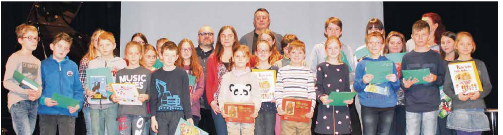
Spoločná foto ocenených autorov titulom Mladý Jesenský z bánovských škôl s porotou... Ocenení z iných škôl okresu sa slávnosti nezúčastnili, diplomy a knižné dary prevzali zástupcovia školy