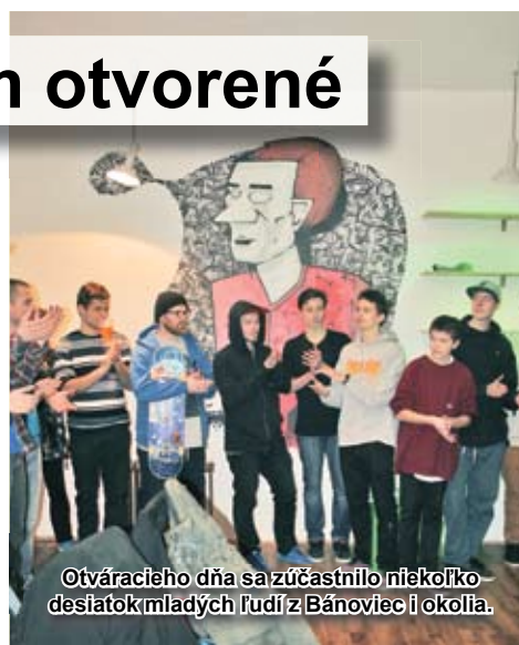
Otváracieho dňa sa zúčastnilo niekoľko desiatok mladých ľudí z Bánoviec i okolia.

Mladí ľudia združení okolo Športovo-herného a outdoorového klubu, o.z. majú za sebou to najhlavnejšie a v sobotu 8. februára slávnostne otvorili novovybudované mládežnícke centrum. Nevyužívané triedy v budove ZŠ Gorazdova sa za posledné mesiace zmenili na miesto, ktoré ponúka priestor pre mnohé aktivity.