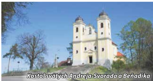
Kostol svätých Andreja-Svorada a Beňadika