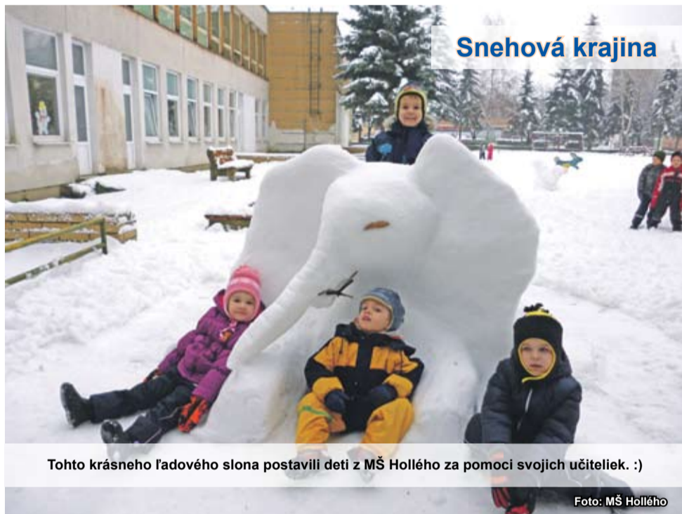
Tohto krásneho ľadového slona postavili deti z MŠ Hollého za pomoci svojich učiteľiek. :)

Do tanca hrá HS Vega . Vstupné: 7 € (hudba a večera) Vstupenky je možné zakúpiť v Klube dôchodcov na Farskej ulici.