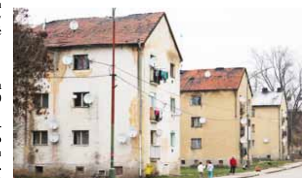
Pre vyše 400 obyvateľov sú už tieto bytovky nebezpečné...

● Delegácia moravského mesta Koprivnice bola 16.