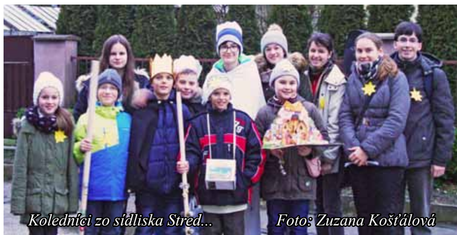
Koledníci zo sídliska Stred...

Koledníkov Dobrej noviny sme v našom meste mohli stretnúť už po dvadsiaty krát. Tento rok sa do koledovania zapojilo 46 detí v štyroch skupinách, ktoré sprevádzalo päť dospelých. Koledovali na sídliskách Sever, Stred, Dubnička a v Dolných a Horných Ozorovciach. Navštívili celkom šesťdesiat domácností a vyzbierali sumu 2210 eur.