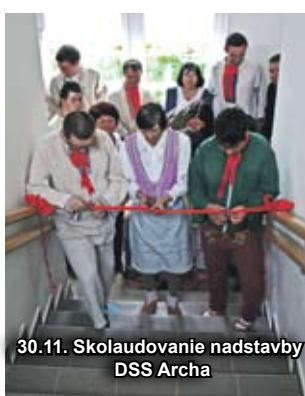
30.11. Skolaudovanie nadstavby DSS Archa