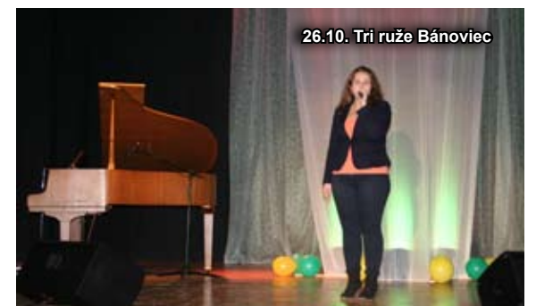
26.10. Tri ruže Bánoviec