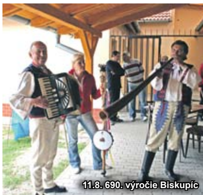
11.8. 690. výročie Biskupíc