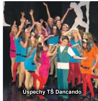
Úspechy TŠ Dancando