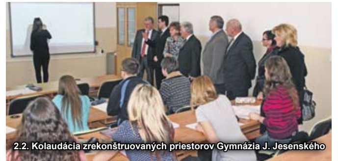
2.2. Kolaudácia zrekonštruovaných priestorov Gymnázia J. Jesenského