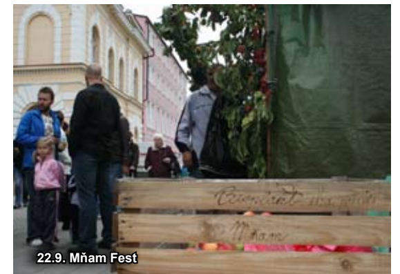
22.9. Mňam Fest