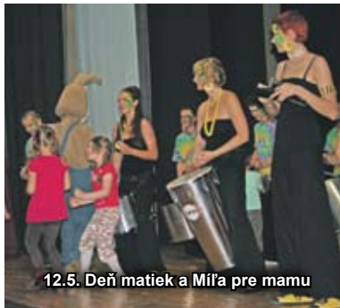
12.5. Deň matiek a Míľa pre mamu