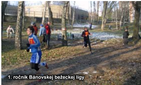
1. ročník Bánovskej bežeckej ligy

Stavebný odpad: tehly, betón, kamenivo, obkladačky, piesok.