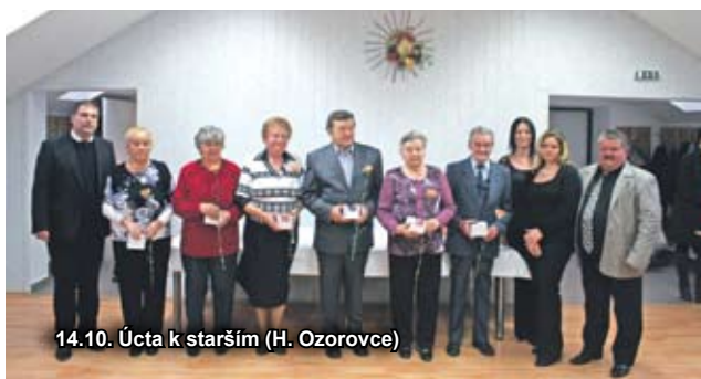
14.10. Úcta k starším (H. Ozorovce)