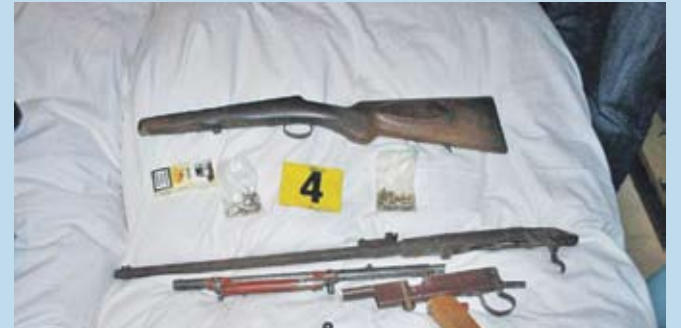
KR PZ TN

Z uvedeného dôvodu bánovský vyšetrotel' začal dňa 2. januára trestné stíhanie vo veci zločinu nedovoleného ozbrojovania a obchodovania so zbraňami. V oboch prípadoch naďalej prebieha vyšetrotvanie.