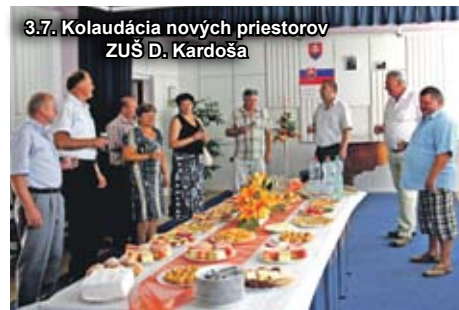
3.7. Kolaudácia nových priestorov ZUŠ D. Karďoša