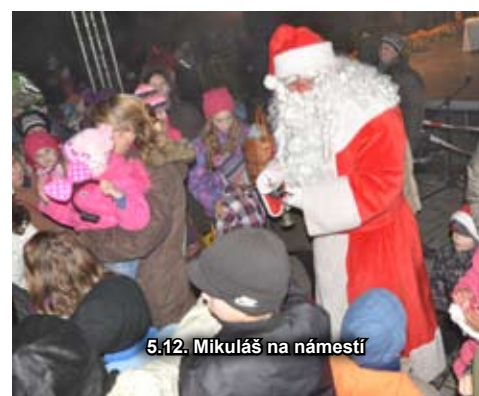
5.12. Mikuláš na námestí