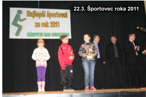
22.3. Športovec roka 2011