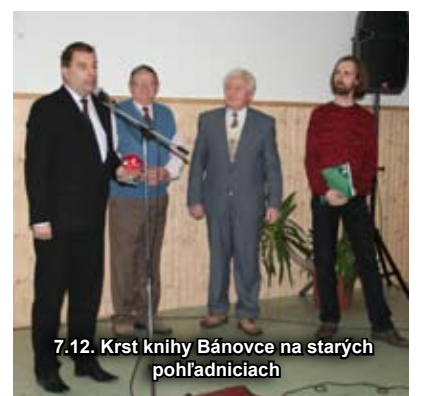
7.12. Krst knihy Bánovce na starých pohľadniciach