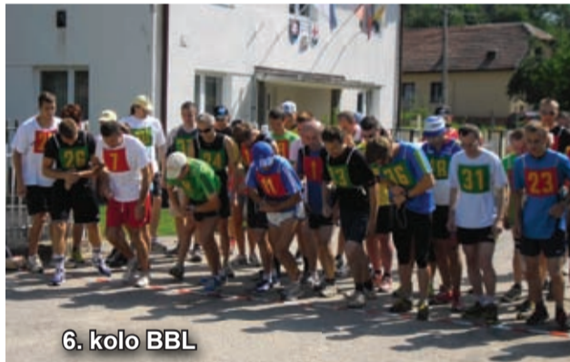
6. kolo BBL

Konečné poradie: 1. Chynorany, 2. Kde nič...tu my (BN), 3. Sokol Bánovce nad Bebravou, 4. VKV Bánovce nad Bebravou, 5. Nové mesto nad Váhom 6. Serena Bánovce nad Bebravou jo, ph