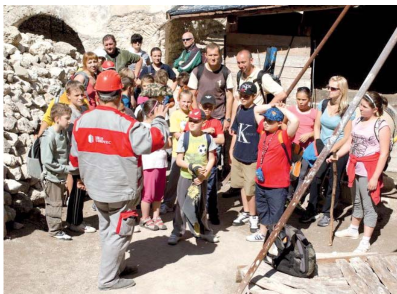
Členovia turistického krúžku zo ZŠ Partizánska a ZŠ Gorazdova na Uhrovskom hrade