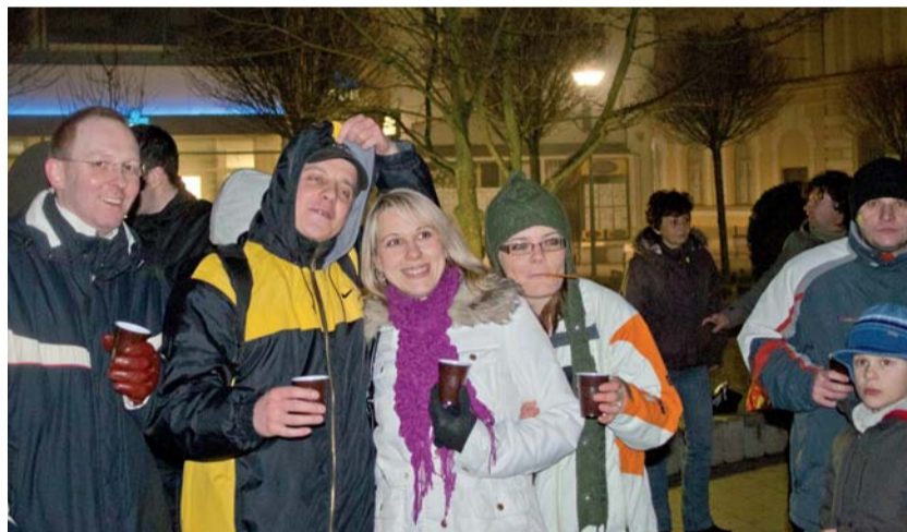
Bánovčania na Silvestra v centre mesta...

Redakcia Bánovských novín Vám do ďalšieho roka praje veľa optimizmu a pri čítaní čo najmenej chýb, spôsobených tlačiarenským škriatkom. PF 2012!