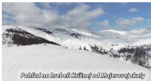
Pohľad na hrebeň Krížnej od Majerovej skaly

Prvá tohtoročná spoločná zimná turistika v pohorí Veľkej Fatry. Krásne zimné počasie s peknými výhľadmi z Majerovej skaly a hlavného hrebeňa Veľkej Fatry sme si užívali do sýtosti. Nielen nás turistov vytiahlo do hôr pekné zimné počasie. Skialpinistov, snowboardistov i bežkárov čakali na hrebeni skvelé podmienky. A tak nás tam bolo všetkých neúrekom. Veď prečo aj nie. Slnko hrialo, bolo nádherné teplo a až pod vrcholom Krížnej fúkal silný nárazový vietor. Ale tam fúka asi