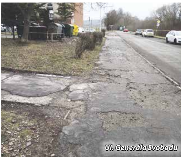
Ul. Generála Svobodu

„Rekonštrukciou atletického oválu ZŠ Gorazdova by sa kompletne zmenil celkový vzhľad, funkčnosť a bezpečnosť využitia pre všetkých návštevníkov atletickej dráhy, vrátane detí ZŠ Gorazdova a ZŠ J.A. Komenského, taktiež pre rozvoj športu u detí, mládeže, športových talentov, ale aj pre širokú verejnosť, vrátane zdravotne postihnutých občanov. V prvej fáze realizácie by došlo k rekonštrukcii pôvodného škvarového atletického oválu tak, aby vznikla bežecká dráha s umelou športovou povrchovou úpravou s vodorovným značením pre tri pruhy v dĺžke 400 m a štyri pruhy v rovnom úseku oválu s dĺžkou 100 m. Celková výška výdavkov na projekt podľa rozpočtu je 151 568,23 eur . Spolufinancovanie Mesta Bánovce nad Bebravou predstavuje 60 627,29 eur .“ NFP je žiadaný z Fondu na podporu športu. Predloženie žiadosti o NFP bolo jednohlasne schválené.