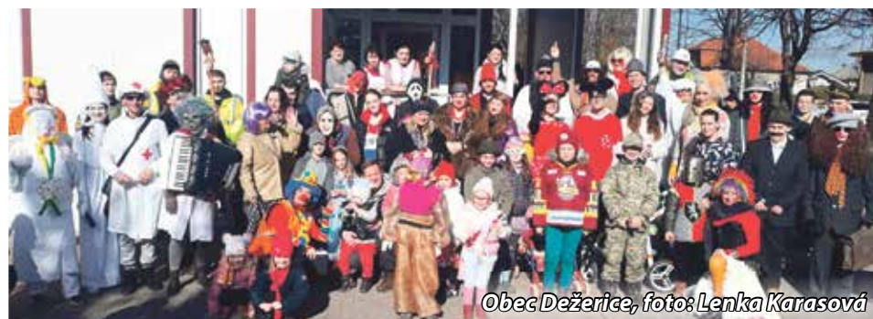
Obec Dežerice, foto: Lenka Karasová

V mestskej časti Dolné Ozorovce sa v sobotu 26. februára po dvoch rokoch uskutočnil tradičný fašiangový sprievod. Pod toto podujatie sa organizačne podpísali členovia výboru mestskej časti a dobrovoľného hasičského zboru. Krátko pred dvanástou hodinou sa