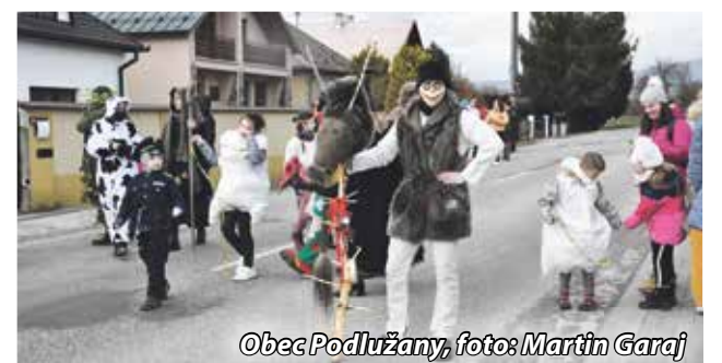
Obec Podlužany, foto: Martin Garaj