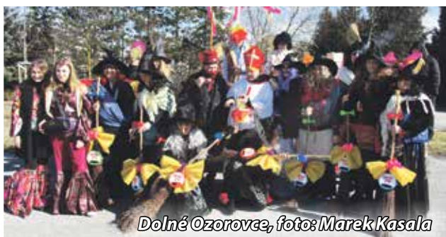
Dolné Ozorovce

Fašiangy boli oddávna obdobím radosti, veselosti a hojnosti. Hoci pandemické opatrenia ich tento rok neumožnili vopred naplánovať, nakoniec počas posledného fašiangového víkendu došlo k uvoľneniu opatrení. A tak sme si mohli fašiangovú atmosféru užiť aspoň trochu. Takto vyzeralo v Dolných Ozorovciach, Dežericiach a Podlužanoch.