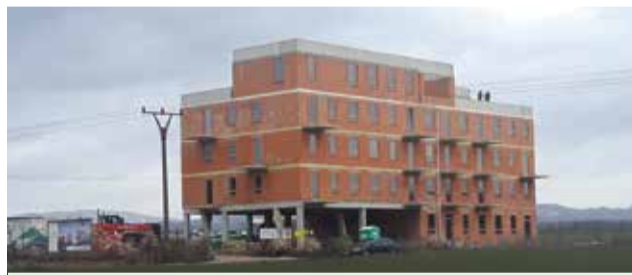
Výstavba bytového domu na Husitskej ulici

Na sídlisku Dubnička začala prebiehať výstavba dvoch bytových domov. Na Husitskej ulici, nad ZŠ Gorazdova, začala výstavba prvého z piatich povolených bytových domov. Spolu by tu malo vyrásť päť bytových domov so 135 bytmi, z toho 30 bude 1-izbových,