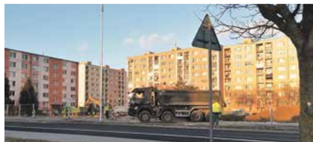
Výstavba polyfunkčného domu na Novomeského

V rámci investícií, ktoré bude realizovať mesto na sídlisku Dubnička ešte pribudne jedna nájomná bytovka s 22 nájomnými bytmi. Bude to v blízkosti už existujúcej nájomnej bytovky pri Kauflande, bližšie ku komunikácii na Svätoplukovej ulici. V tomto roku máme v pláne spracovať projektovú dokumentáciu na objekt bývalého odevného učilišťa, kde je zámer prerobiť ďalšie byty, ktoré budú mať rovnako nájomný charakter. (lk)