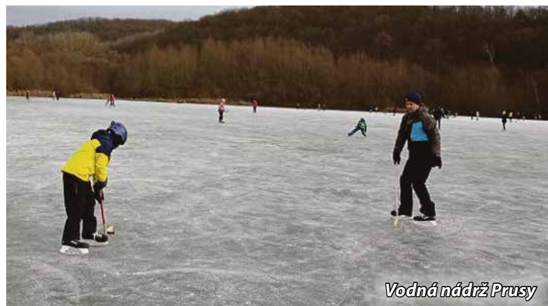
Vodná nádrž Prusy